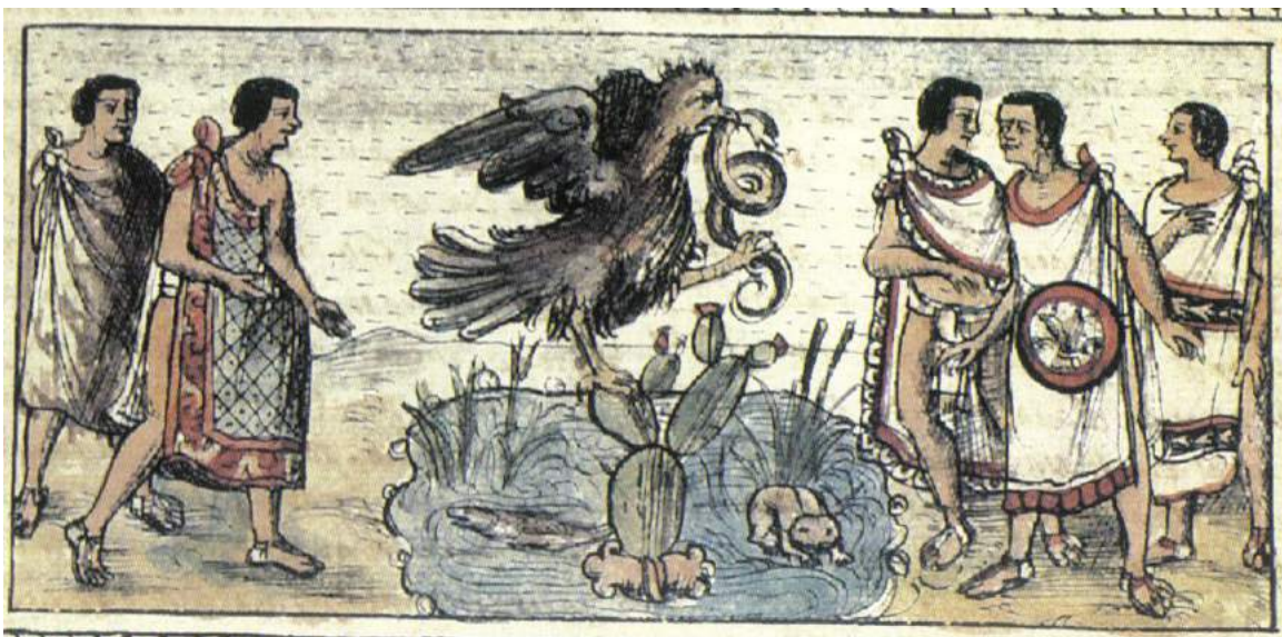
Figura 2: Ilustración que acompaña el índice de capítulos de la obra de Fray Diego Durán, (Durán 2002: s/p, señalada como lámina 1 del tomo II).

[...] Volvieron inmediatamente a Toltzallan, a Acatzallan, a Oztotempan y llegaron a Acatitlan, donde se levanta el “tenochtli” (al borde de la cueva vieron cuando, erguida el águila sobre el nopal, come alegremente, desgarrando las cosas al comer, y así que el águila les vió agachó muy mucho la cabeza, aunque tan sólo de lejos la vieron ellos), y su nido o lecho, todo él de muy variadas plumas preciosas, de pluma de cotinga azul, de flamenco rojo, de quetzal, y vieron asimismo esparcidas ahí las cabezas de muy variados pájaros, de las aves preciosas, que estaban ensartadas, así como algunas garras y huesos de pájaro (Tezozómoc 1998:65-66).