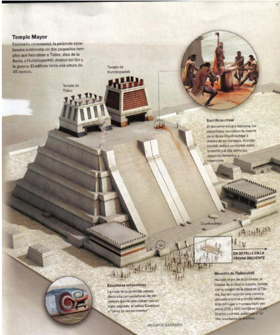
Figura 12: Ilustración de Hernán Cañellas en Robert Draper, 2010:13.

[...] se refleja desde el punto de vista mítico la justificación del sacrificio humano como una manera de retribuir al dios el sacrificio que éste hizo, aunque la derivación del sacrificio sea la guerra como medio de aprisionar y sacrificar además de imponer un tributo al pueblo conquistado. Esto se ve también en la presencia de los dioses del agua —Tláloc— y de la guerra —Huitzilopochtli— en el Templo Mayor de Tenochtitlán, que corresponde a la base económica sobre la que se sustentan los aztecas, el más conocido de los grupos nahuas (Matos Moctezuma 2008:149).