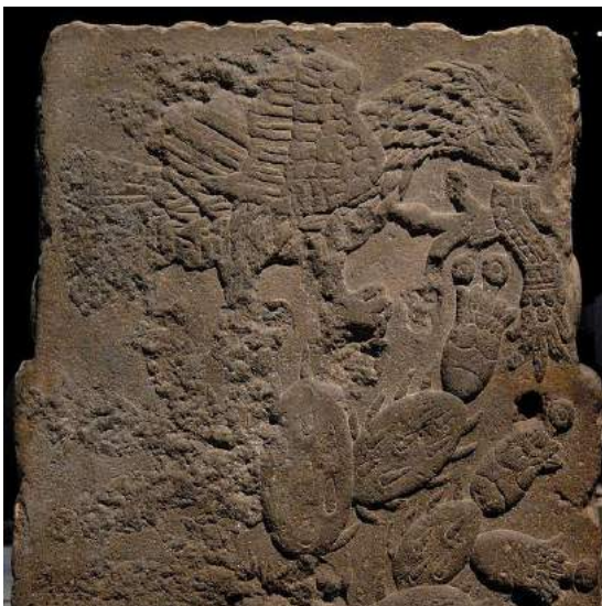
Figura 8: Teocalli de la Guerra Sagrada.

Nuevamente tenemos esta referencia no a un pasado arqueológico, sino a la fuerza de un mito fundante que funda y sigue fundando cada vez que se actualiza el mito en el ritual, pues recordemos que la imagen de la Coyolxauhqui que hoy está en el museo del Templo Mayor en la Ciudad de México, se encontraba al pie de las escalinatas del Templo Mayor, del lado del templo de Huitzilopochtli, donde en lo alto eran sacrificados los cautivos —enemigos de los mexicanos— y arrojados por la escalinata, cayendo cerca de la imagen de la Coyolxauhqui, con lo que se repetía el mito de origen. Así lo narra Sahagún en su Historia General de las Cosas de la Nueva España : «después de haberles sacado el corazón, y después de haber echado la sangre en una jícara, la cual recibía el señor