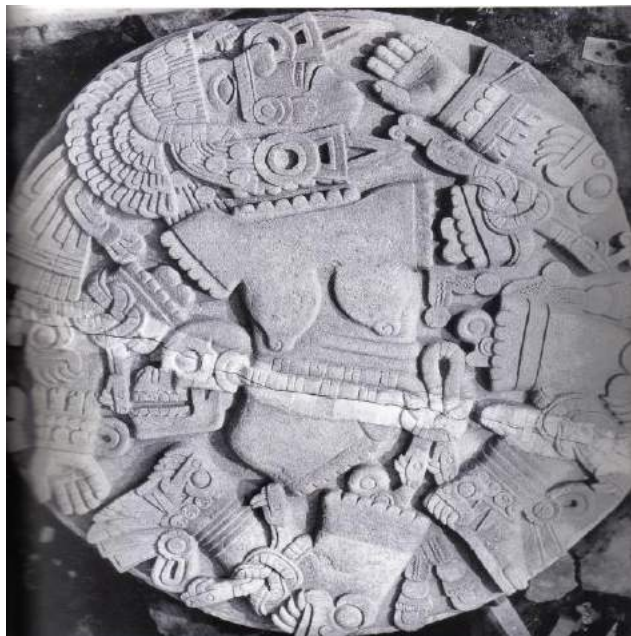
Figura 10: Coyolxauhqui.

del mismo muerto, echaban el cuerpo a rodar por las gradas abajo del cu , e iba a parar en una placeta» (Sahagún 1992:78). Así se ilustra en diversos documentos coloniales donde se describían estas ceremonias (ver figura 11).