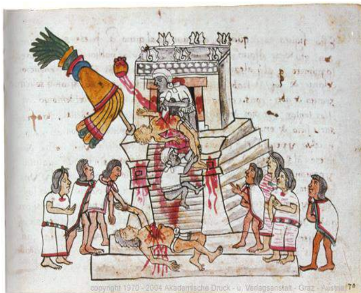
Figura 11: Códice Magliabechiano , p. 70. Tomado de: http://www.famsi.org/spanish/rsearch/graz/magliabechiano/img_page141.html 12 de marzo de 2012.

No estamos totalmente de acuerdo con León-Portilla cuando asienta que el hombre del Quinto Sol, el mexica, trata de preservar el orden universal y evitar el cataclismo final, para lo cual acuden a la guerra y al sacrificio como parte de ese intento de mantener y prolongar la energía vital del Quinto Sol. Más bien pensamos que esto obedece al hecho de que el Sol, al cual pertenecen, debe continuar su andar, pero no con el fin de evitar el destino que se ha presentado en soles anteriores, es decir, su destrucción. Creemos que, al igual que los soles anteriores, por esa lucha constante entre los dioses, el Quinto Sol y el