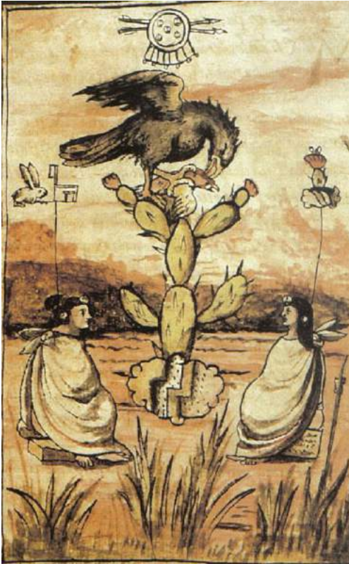
Figura 1: Ilustración que acompaña el capítulo v de la obra de Fray Diego Durán, (Durán 2002: s/p, señalada como lámina 6 del tomo I).

dechado, lugar de asiento del “tenochtli” (tuna dura), que está en el interior del agua; lugar en donde se yergue, grita y desplégase el águila,