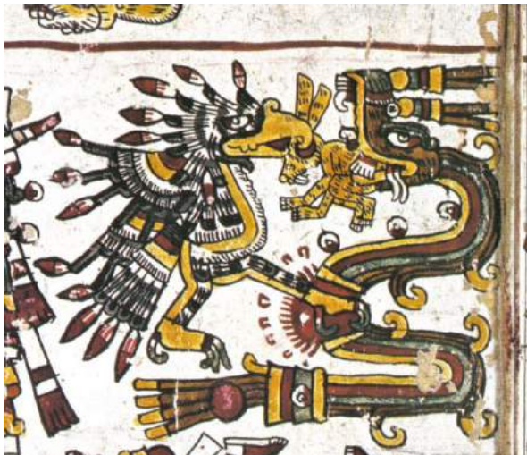
Figura 3: Códice Borgia p. 52. Extremo superior derecho de la escena contenida en la franja baja.

Este mismo autor, en su otra obra Crónica mexicana , escrita en español, refiere nuevamente esta escena, pero ahora sí mencionando tanto al águila como a la serpiente: