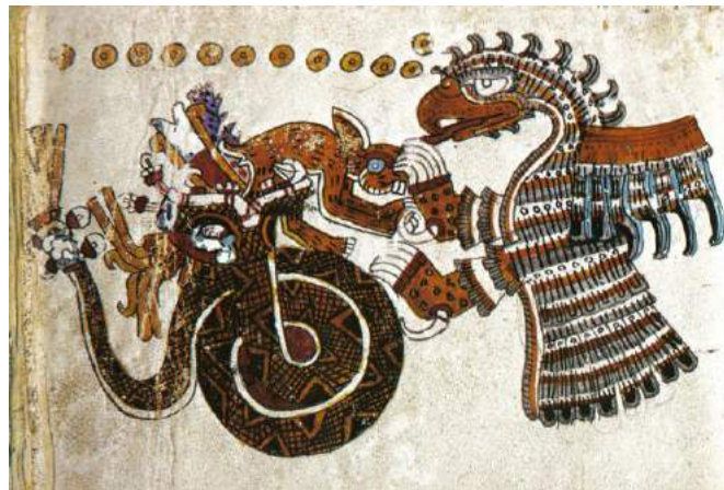
Figura 4: Códice Vaticano "B" o Vaticano 3773 , p. 27.

Ahora bien, es interesante señalar que la lucha entre el águila y la serpiente es una escena que aparece ya en algunos códices prehispánicos. Como mencioné