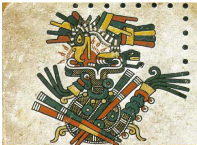
Figura 5: Códice Fejervary-Mayer , p. 42. Escena superior izquierda.

Águila y serpiente son dos animales que, desde las culturas prehispánicas, están cargados de un fuerte simbolismo. El águila se relaciona intrínsecamente con el sol, es un animal celeste que encarna la fuerza diurna —de hecho— nahual del Sol. No en vano la usaba una de las élites de la clase militar mexicana, los llamados guerreros águila , junto con la otra élite, los guerreros jaguar , animal que por su parte encarnaba