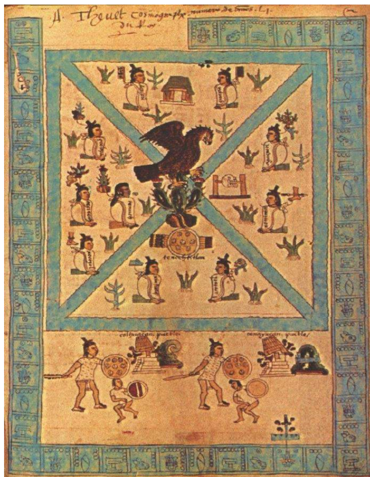
Figura 7: Códice Mendocino . Lámina 1.

emerge de él y el águila que posa encima de éste devorando la serpiente, refiere a la fundación de Tenochtitlán en cuanto centro cósmico de este grupo étnico que se enseñoreó en la zona lacustre después de un largo proceso de luchas por posicionarse en medio de los otros grupos ya asentados en el área antes que ellos. Pasaron así los mexicas de un grupo en condiciones adversas a uno que regiría toda esta zona y desbordaría los límites de la misma en una expansión militar, económica e ideológica. El lugar es, pues, el lugar donde se derrotó a los enemigos por intervención de su dios tutelar Huitzilopochtli, los enemigos encarnados en Copil, del cual surge el nopal y donde ocurre la hierofanía fundacional. Esto se refuerza con el templo mayor identificado como Coatépétl donde Huitzilopochtli nace armado y derrota a Coyolxahuqui y a los 400 huitznahua, tal como lo muestran Alfredo López Austin y Leonardo López Luján en Monte Sagrado-Templo Mayor (2009). 3 Recordemos el relato indígena de este conflicto: